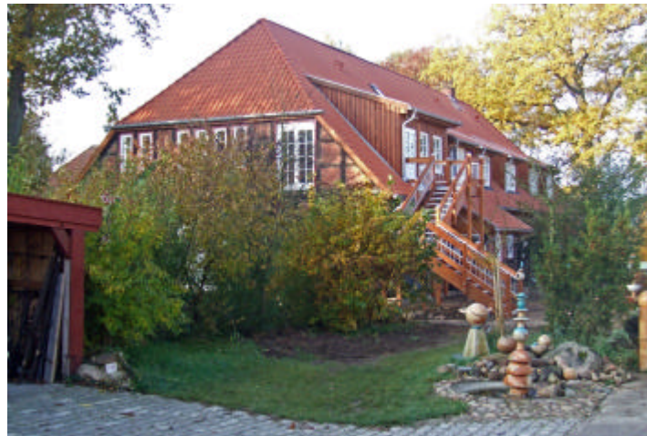
Der Bauckhof in Stütens

Vom Getreidekorn bis zum fertigen Produkt finden alle Verarbeitungsschritte in der eigenen Bauckhof Mühle statt. Ob Reini-